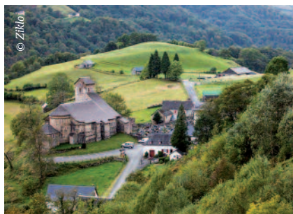
Bild unten | Auf einer Bergpässe-Tour im Baskenland entdeckt man auch hübsche, kleine Gemeinden wie hier Sainte-Engrâce.

Zur geographischen Einordnung: Das französische Baskenland grenzt an die spanischen Autonomen Gemeinschaften Navarra und Baskenland im Süden, im Westen an den Golf von Biskaya, im Norden an das französische Département Landes und an die historische Provinz Béarn im Osten. Längs der Südgrenze verläuft der westlichste Teil der Pyrenäen.