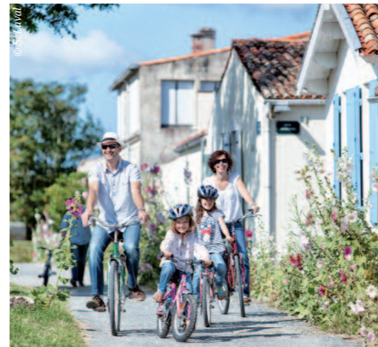
Bild ganz links | Traumhaft schön: Sonnenuntergang über La Rochelle. Bild ganz oben | Lust auf Glamping (»Glamorous Camping«)? Bild oben | Entspannte Radtour auf der Île-d'Aix.

Es geht »maritim« weiter, denn auf dem ehemaligen Hafengelände von Rochefort erstreckt sich eine schlossähnliche Anlage, die bisweilen als »l' Arsenal des Mers« apostrophiert wird. Hier haben mehr als 550 Schiffe das Licht der Welt erblickt. Überhaupt hat das »Meeresarsenal« in Rochefort, »l' Arsenal des Mers«, nach drei Jahrhunderten maritimer Geschichte viel zu bieten und lässt Besucher zu Entdeckern werden. Wie wäre es zum Beispiel mit einer Schifffahrt um das berühmte Fort Boyard von Rochefort Océan?