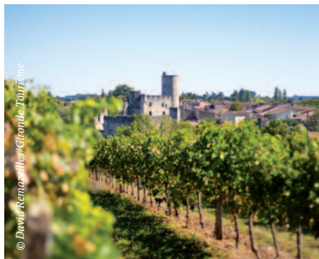
Bild unten | Das Weinbaugebiet Bordeaux, auf Französisch Bordelais, ist das größte zusammenhängende Anbaugebiet der Welt für Qualitätswein.

La Vélodyssée, der Radfernweg des Atlantiks, folgt der Gironde auf einer 170 Kilometer langen Strecke. Die Strecke beginnt an der Pointe de Grave, gegenüber dem Leuchtturm von Cordouan (seit Juli 2021 UNESCO-Weltkulturerbe), durchquert Dünen, Pinienwälder und die großen Seen, verläuft durch die etwa 155 Quadratkilometer große Bucht Bassin d'Arcachon und endet am Fuß der höchsten Wanderdüne Europas, der Dune du Pilat. Auf 100 bis 110 Meter türmt sich hier der Sand – ein echtes Naturwunder.